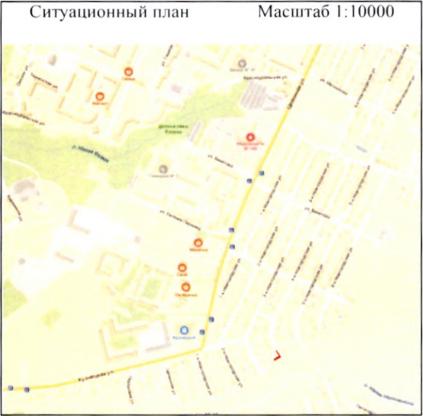
59.01.1.11 - Зона индивидуальной жилой застройки городского типа (Ж-4)

Объект: проезды, в том числе вдольтрассовые, и подъездные дороги, для размещения которых не требуется разрешения на строительство, расположенные южнее земельного участка с кадастровым № 59:01:3911642:27 по адресу: Пермский край, г. Пермь, Мотовилихинский район, ул. 4-я Новгородская, 119. Местоположение: южнее земельного участка с кадастровыми № 59:01:3911642:27 по адресу: Пермский край, г. Пермь, Мотовилихинский район, ул. 4-я Новгородская, 119. Площадь земель или части земельного участка: 324 кв.м. Категория земель: земли населенных пунктов Вид разрешенного использования: -