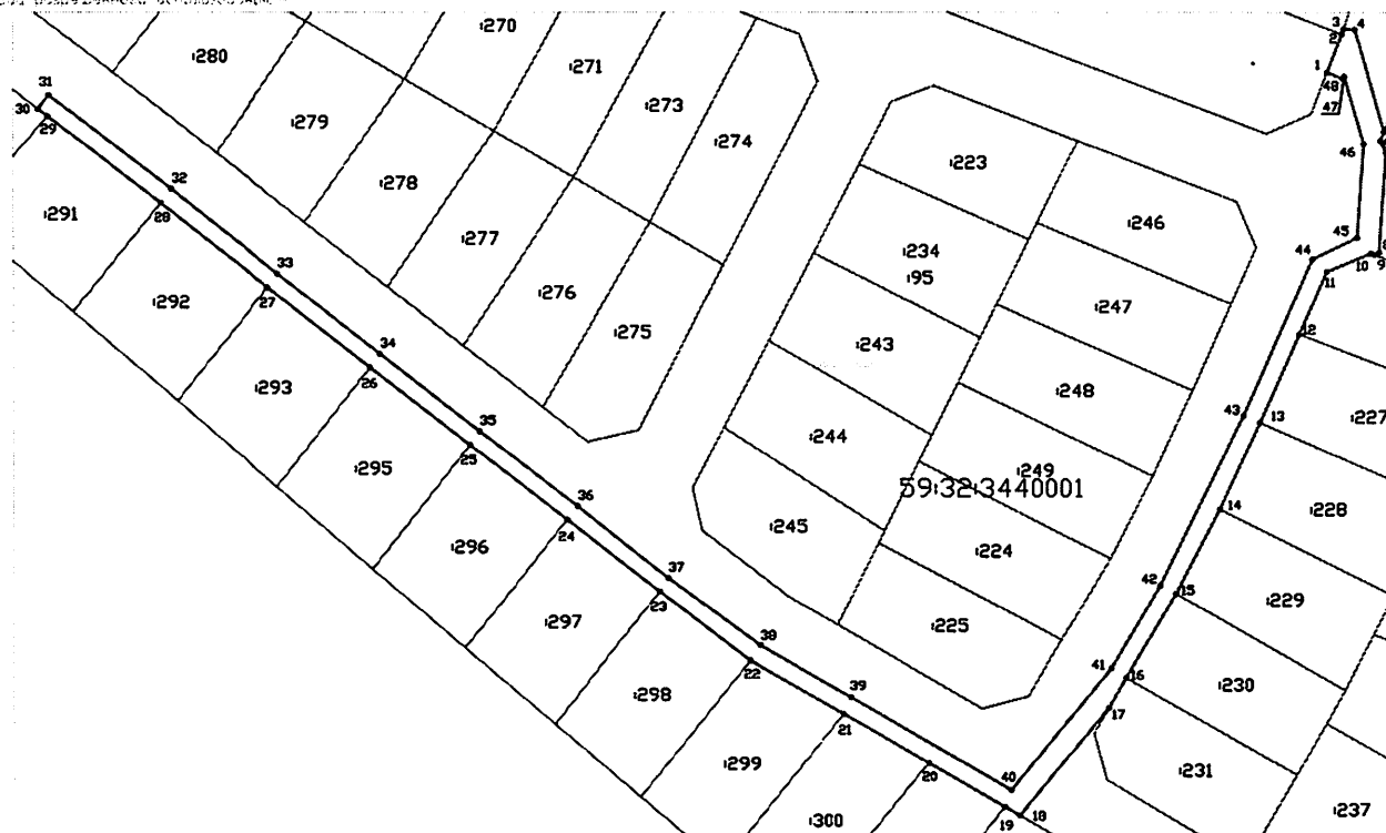
Copyright © 2001 by John Wiley & Sons, Inc.