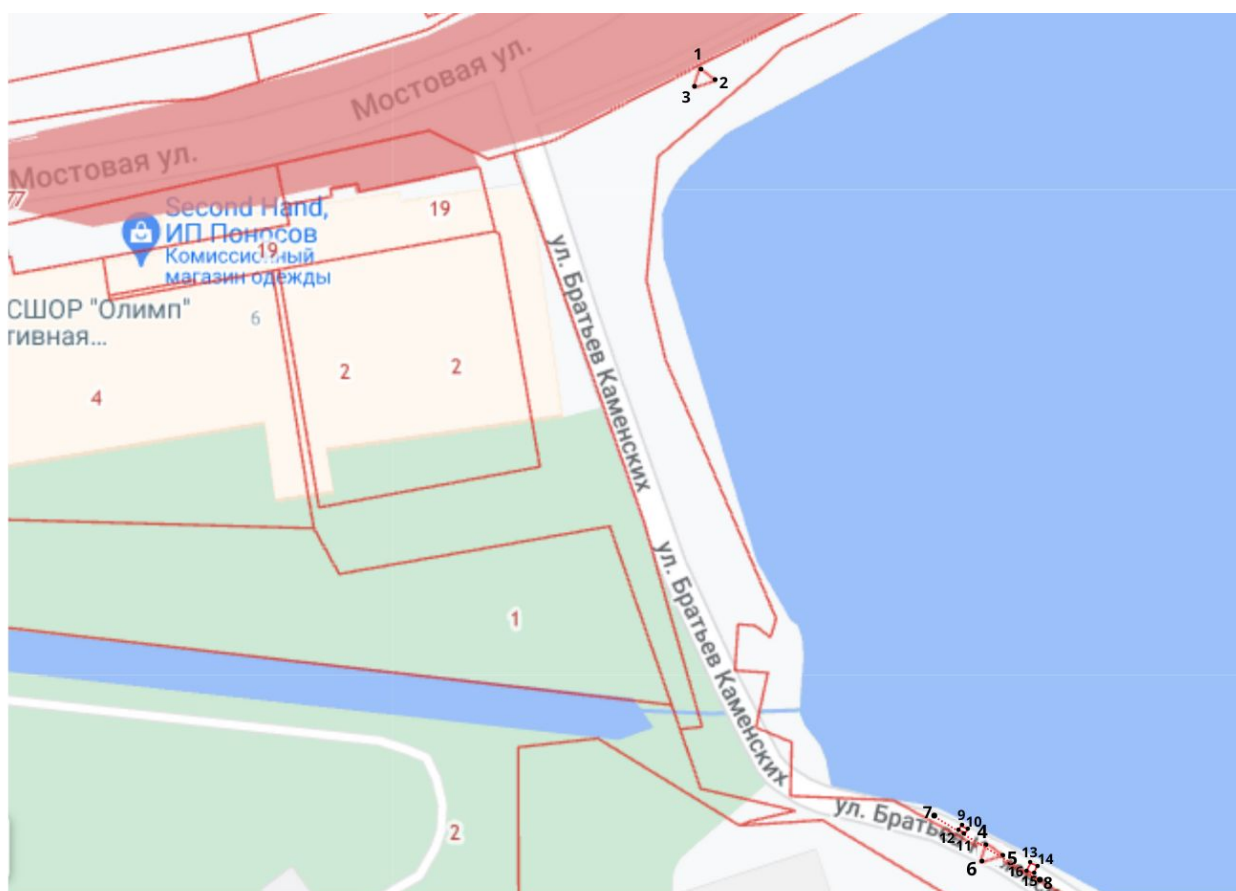
Схема размещения объектов кабельного вейк-парка на акватории Мотовилихинского пруда