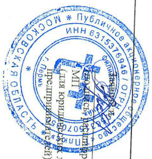
СХЕМА предположительных к использованию земель или части земельного участка Объект: тепловые сети всех видов, включая сети горячего водоснабжения, для размещения которых не требуется разрешение на строительство; Местоположение: г. Пермь, г.о. Пермский Площадь: 3У1 52 кв. м; Категория земель: земли населенных пунктов; Целевое использование: тепловые сети всех видов, включая сети горячего водоснабжения, для размещения которых не требуется разрешение на строительство.

С.А. Мухоморова (для юридических лиц и индивидуальных предпринимателей)