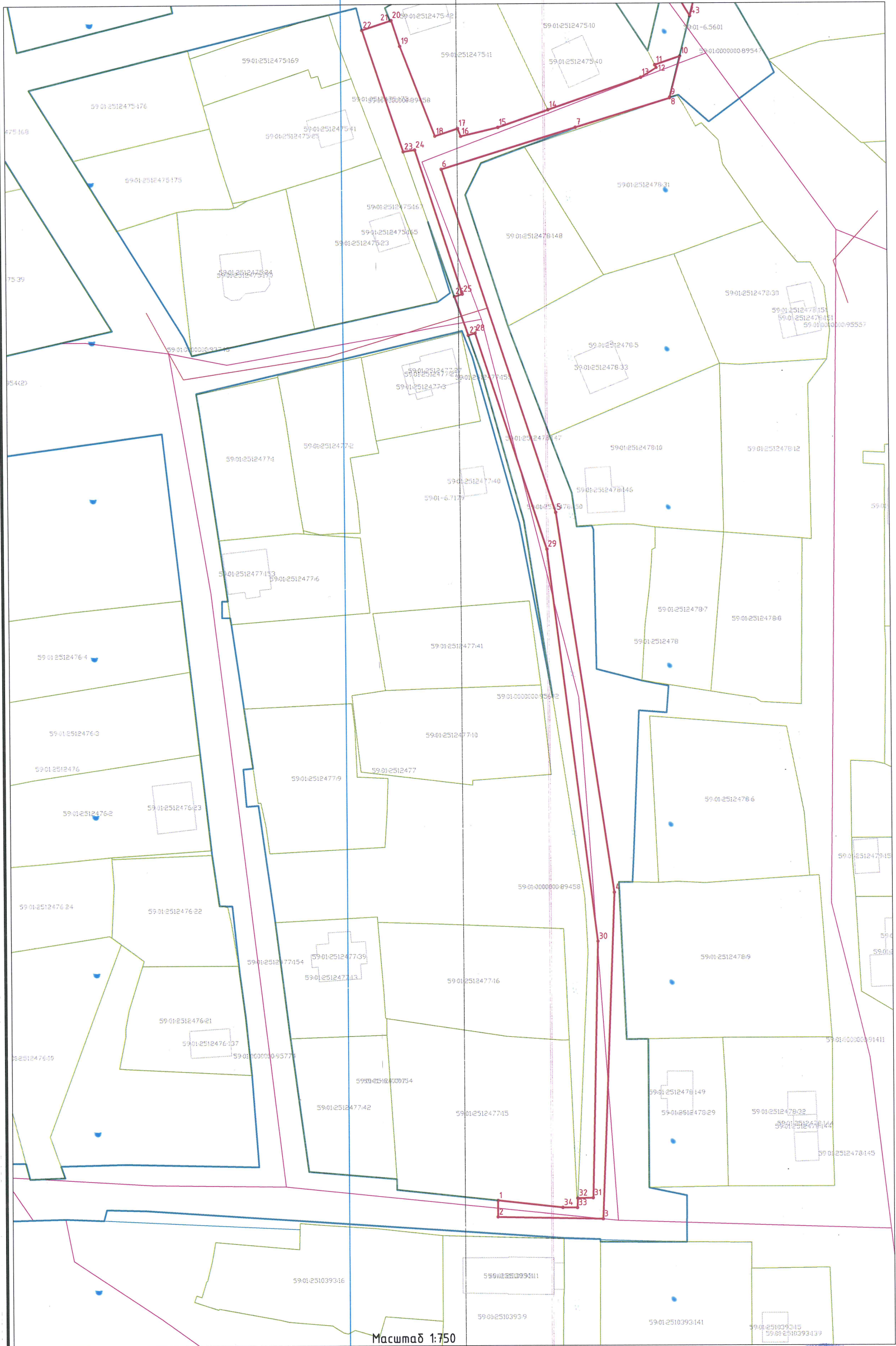
Каталог координат поворотных точек, м Система координат МСК-59

СХЕМА границ предполагаемых к использованию земель или части земельного участка Кадастровый номер исходного земельного участка: 59:01:0000000:1310 Условный номер земельного участка: 59:01:0000000:1310/чз Площадь используемого земельного участка: 3282 кв.м Цель использования: Водопроводы и водоводы всех видов, для размещения которых не требуется разрешение на строительство