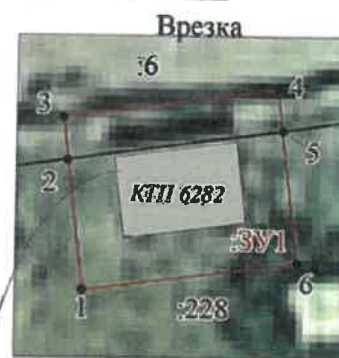
Масштаб 1: 300