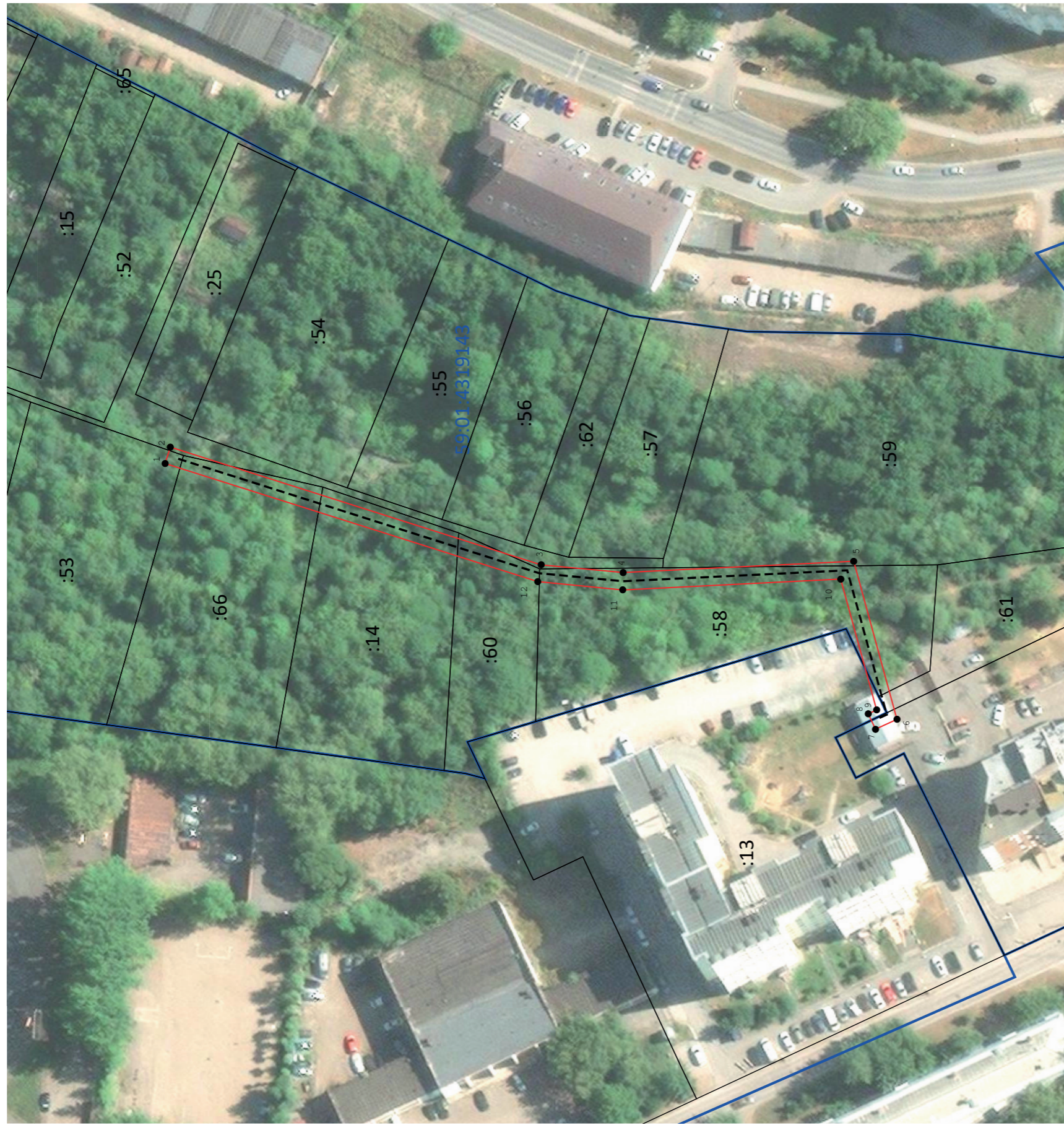
Масштаб 1:1 000