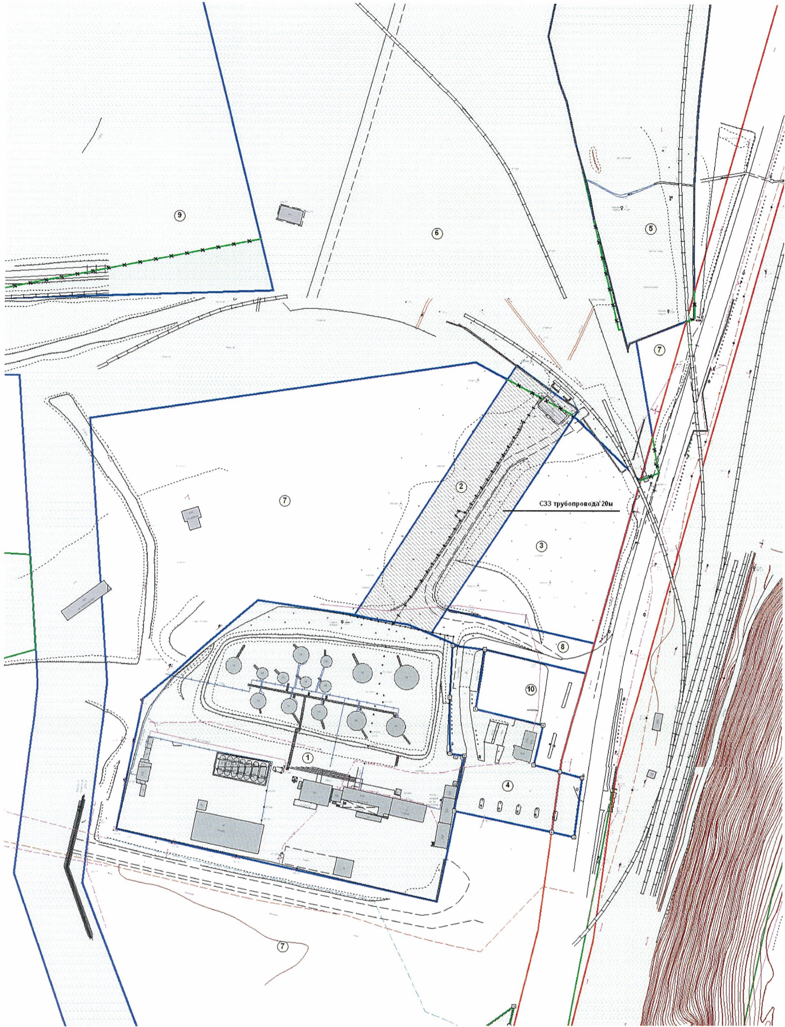
Выкопировка с плана г. Перми М 1:10000